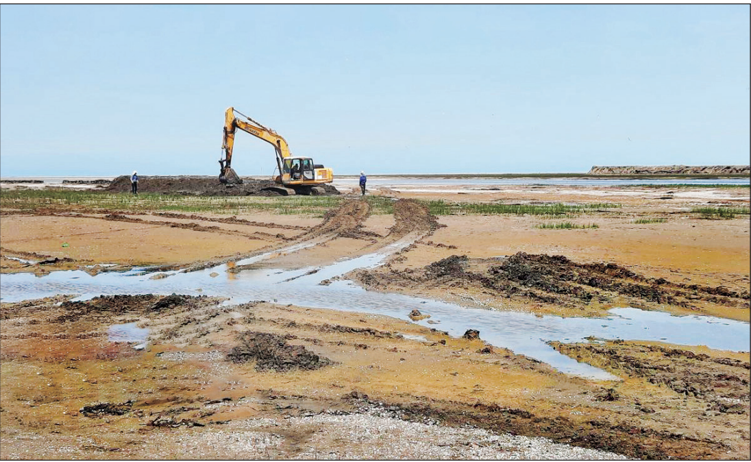
یک نمای هوایی از میانکاله

راه توسعه از کدام قسمت میانکاله و خلیج گرگان می‌گذرد؟