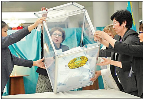
براساس اصلاحات قانون اساسی از این پس پارلمان و دادگاه نوسازی شده قانون اساسی از اختیارات بیشتری برخوردار خواهد شد.

همه‌پرسی تغییر قانون اساسی با هدف محدود کردن قدرت نورسلطان نظریاف انجام شده است