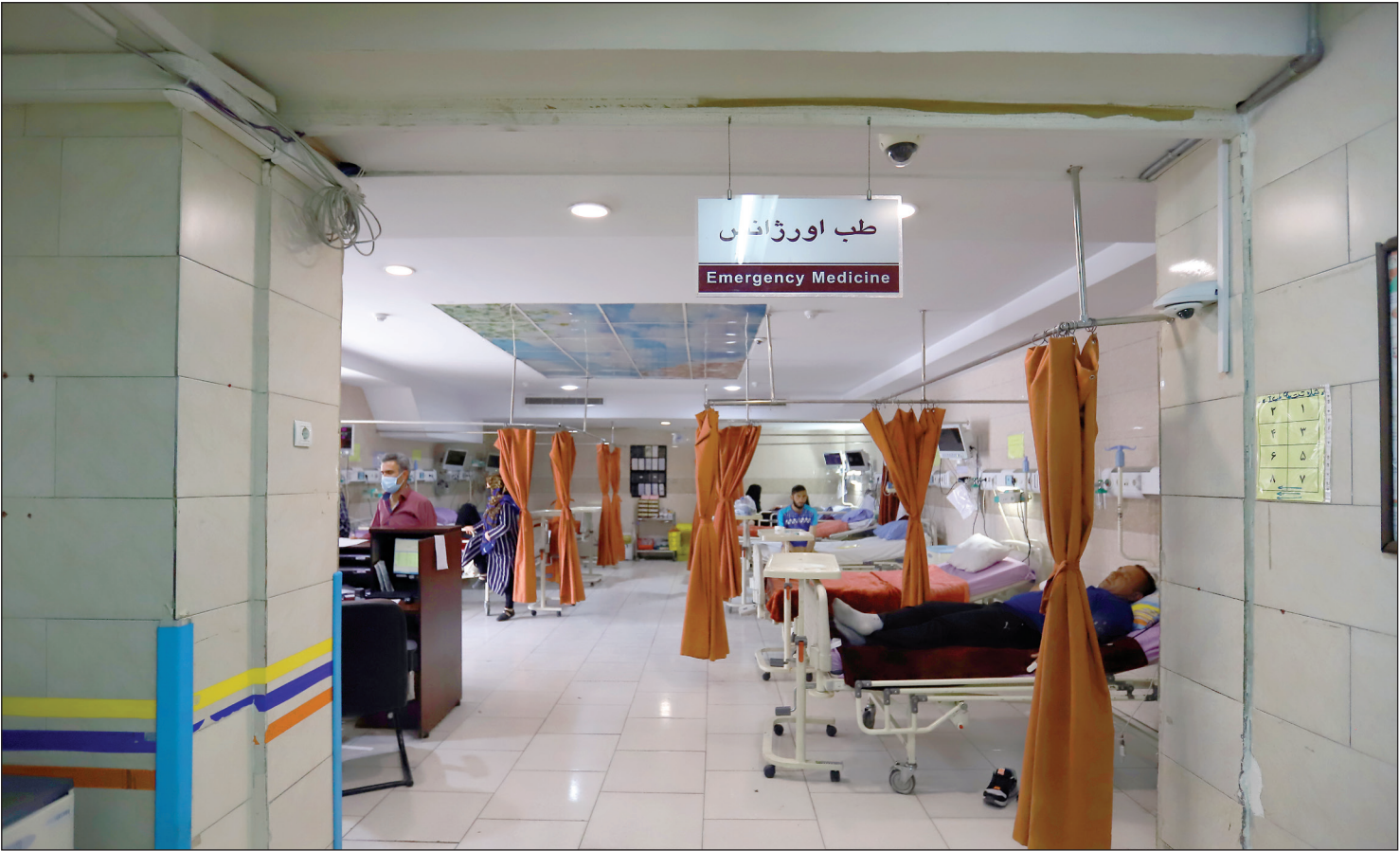
عکس همشهری با ستاغانل