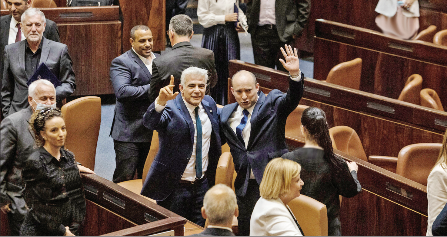
بنت و لاپید با گذشت کمتر از یک سال، دچار اختلافات شدید شده اند.