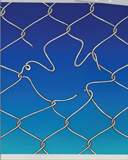
آزادی اثر: یو.جی. ساتو