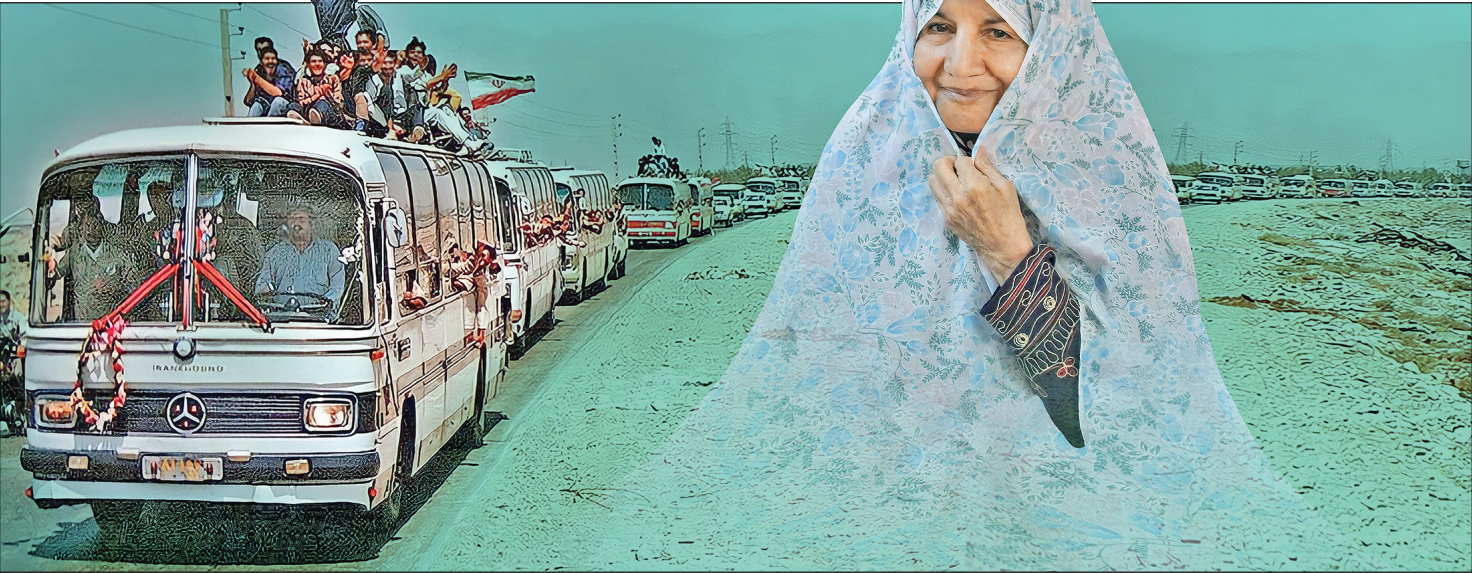
تصویرسازی بهرام غوری