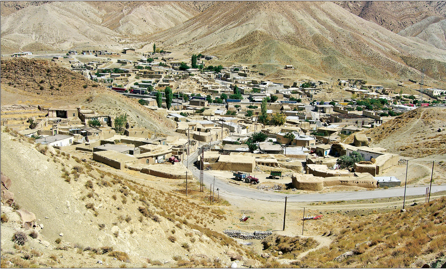
عکس نمای از شهر باجگیران