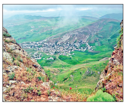
طبیعت بهاری اضماره

روستای اضماره علیا در دل کوه‌های شهرستان گرمی استان اردبیل قرار دارد. این روستا در بیشتر اوقات سال هوای خنک دارد و زمستان پرف و باران زیادی در آن می‌بارد که سبب رویش انواع گیاهان دارویی در این منطقه می‌شود. اضماره به‌دلیل مرتفع‌بودن، مکانی مناسب برای پاراگلایدرسواران است و هرسال در فصل بهار و تابستان شاهد پرواز میهمانان پاراگلایدرسوار در آسمان روستا هستیم. منبع: ایسنا