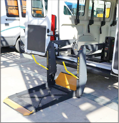
تصویر: سرویس اتوبوس‌های ویژه معلولان