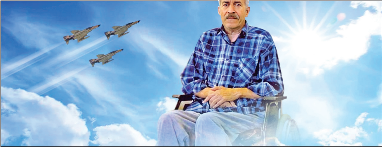
تصویرسازی بهرام غوری