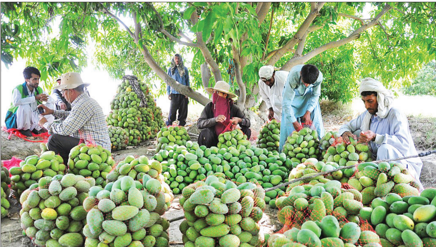
عکس برداشت انبه همشهری