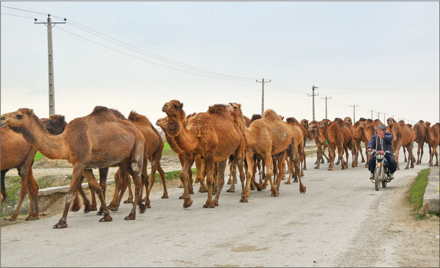
شترها در چاده‌نگس، همشهری استان خراسان