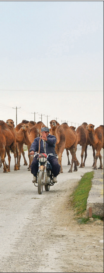
شترها در چاده‌نگس، همشهری استان خراسان

فصل برداشت چای عهانه در شمال کشور به طول می‌انجامد و تلاش و نگرانی چایسکاران در ماه‌های آینده هم ادامه دارد؛ با این حال به‌نظر می‌رسد در سال جدید شورای قیمت‌گذاری چای تلاش کرده است تا کمی از این نگرانی بکاهد. رئیس سازمان چای هم پرداخت تسهیلات و کمک به تولید چای باکیفیت را به چایکاران قول داده است. صنعت چای کشور تاکنون ۳۰ درصد نیاز کشور است، صنعتی که گرچه کوچک نیست اما به حمایت و پشتیبانی بیشتر مسئولان نیاز دارد.