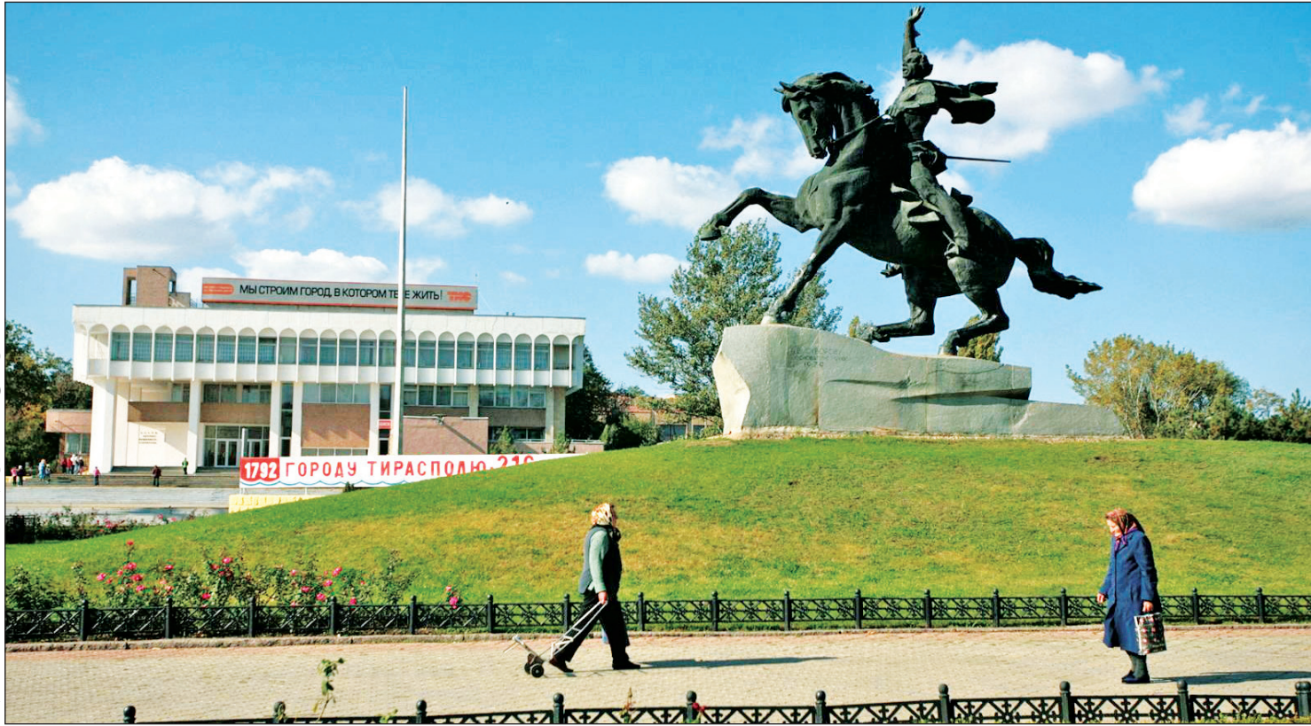
مجسمه الکساندر واسیلیویچ، یکی از فرماندهان امپراتوری روسیه در مرکز شهر تیراسپول

توجه به تغییرات اقلیمی: موضوع تغییرات اقلیمی در کارزارهای انتخاباتی فرانسه حلقه‌ای مفقوده بود که در نهایت مکررون در دور دوم کارزار انتخاباتی اش آن را به موضوعی محوری تبدیل کرد. او در سخنرانی انتخاباتی اش در مارس و وعده‌های بزرگ داد و گفت که سرعت تلاش‌ها برای کاهش انتشار گازهای گلخانه‌ای را دو برابر خواهد کرد و تا سال ۲۰۳۰ آن را به کمتر از ۴۰ درصد خواهد رساند. برنامه‌های او متکی بر فناوری هسته‌ای است تا بتواند به کمک آن کربن را از چرخه تولید برق حذف کند.