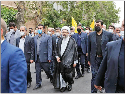
عکس همایش‌های امجدی بیات

رئیس مجمع تشخیص مصلحت نظام گفت: راهپیمایی روز قدس قطعاً نویدبخش نابودی رژیم صهیونیستی است. آیت‌الله آملی لاریجانی با حضور در راهپیمایی روز قدس با اشاره به پیام حضور مردم تصریح کرد: پیام اصلی این حضور، این است که فلسطین همچنان زنده است و آرمان قدس شریف و حمایت از جبهه مقاومت، مسئله و اولویت ملت‌های مسلمان است. وی با اشاره به آیه شریفه «ان تنصروالله بنصرکم» آن را وعده قطعی الهی دانست و افزود: این مردم مظلوم با مقاومت، قیام و جهاد خود، ان شاهانه‌ان بنا به وعده الهی، نصرت حق متعال را جلب خواهند کرد.