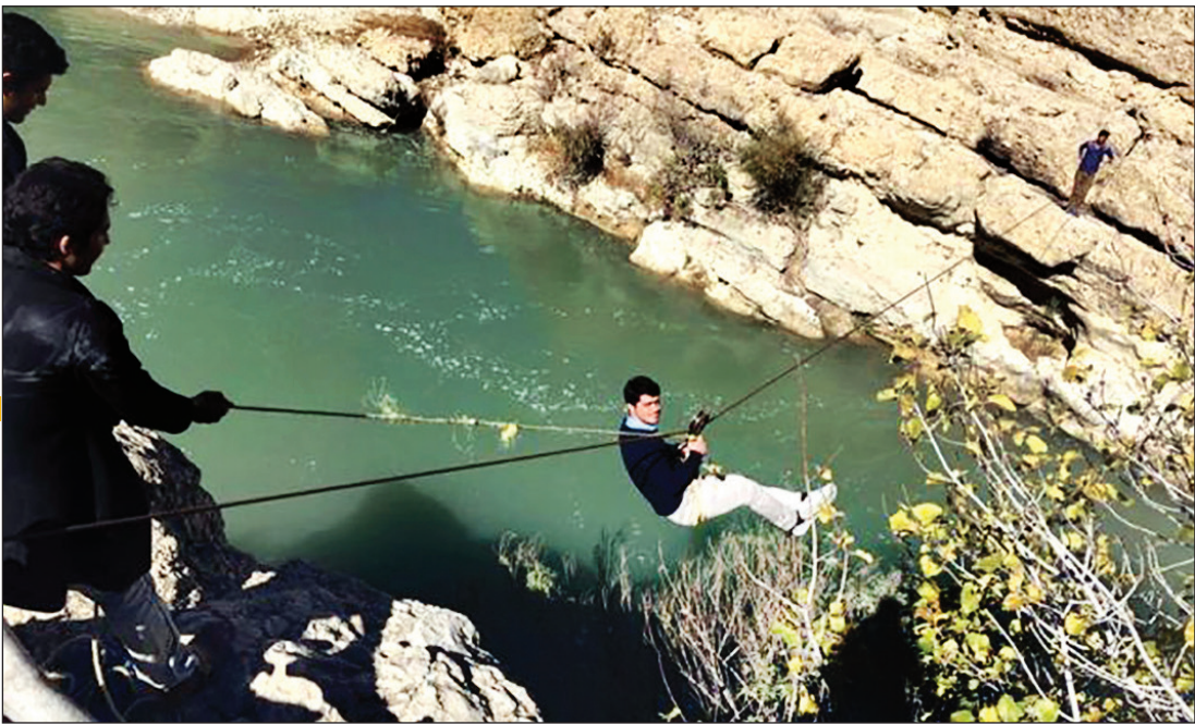
عبور از رودخانه خرسان در بخش خرسان