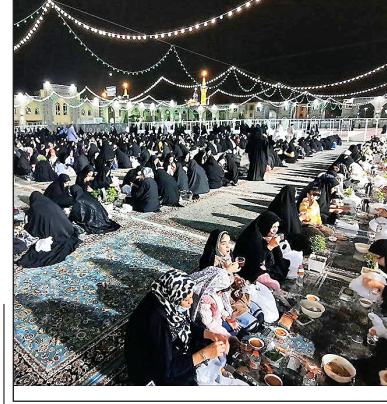
افطاری در حرم مطهر امام رضا (ع)

مطابق رسم هرساله، امسال هم زائران امام مهربانی‌ها مهمان ضیافت افطاری ساده در جوار پارکگاه مطهر رضوی شدند.