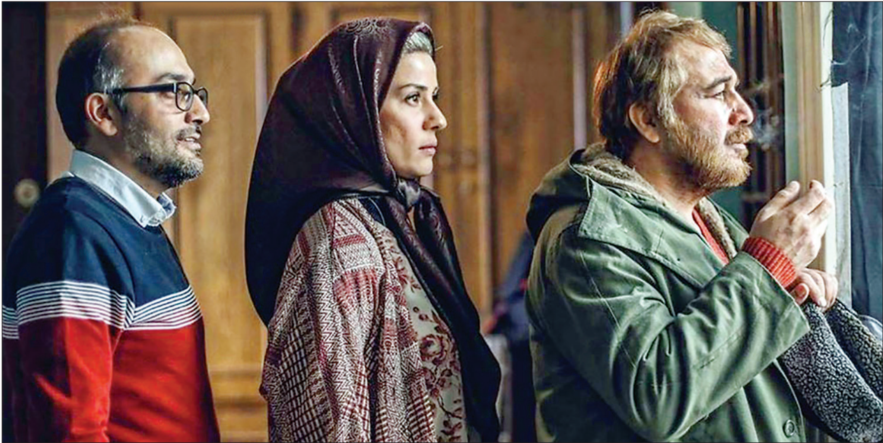
پست‌مختمه فیلم «روش» ساخته روحانگه حجازی که هموراکران نشده‌است.