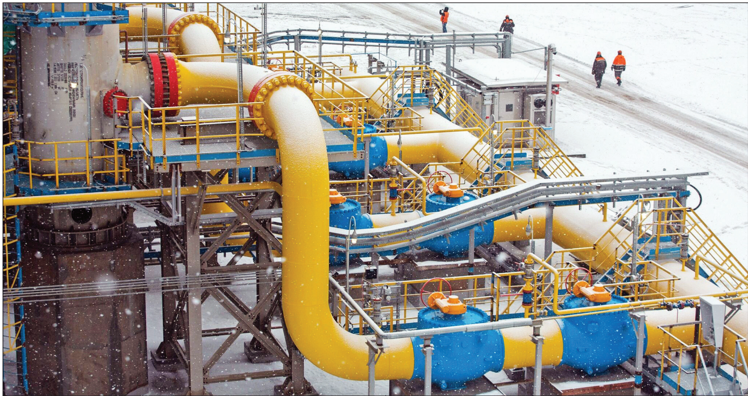
ایستگاه اول خط لوله تور باس ترمیم ۳۰۰ کیلومتر در روسیه - مکتب‌نویس/تیموری

سویان‌ان به نقل از تری مک‌آرو، بنیانگذار پژوهشکده سیاست‌های چین می‌نویسد: اگرچه نارضایتی عمومی نسبت به عملکرد دولت چین در مهار موج اومیکرون افزایش یافته، اما مدتی که دولت بتواند راهی برای برون‌رفت از این بحران بیابد، می‌تواند ورق را به نفع خود برگرداند و بحران اخیر را برای خود به یک پیروزی سیاسی تبدیل کند؛ مشابه همان اقدامی که در سال ۲۰۲۰ در وهان انجام داد. این بار اما نارضایتی از دولت چین در شبکه‌های اجتماعی و به تازگی در خیابان‌های شانگهای نمود پیدا کرده است. در این میان به نظر می‌رسد دولت مرکزی قصد دارد با مقصر خواندن دولت‌های محلی، خود را از این بحران نجات دهد؛ رویکردی که طی هفته‌های گذشته منجر به اخراج چندین نفر از مقامات بهداشتی، به‌ویژه در شانگهای شده است.