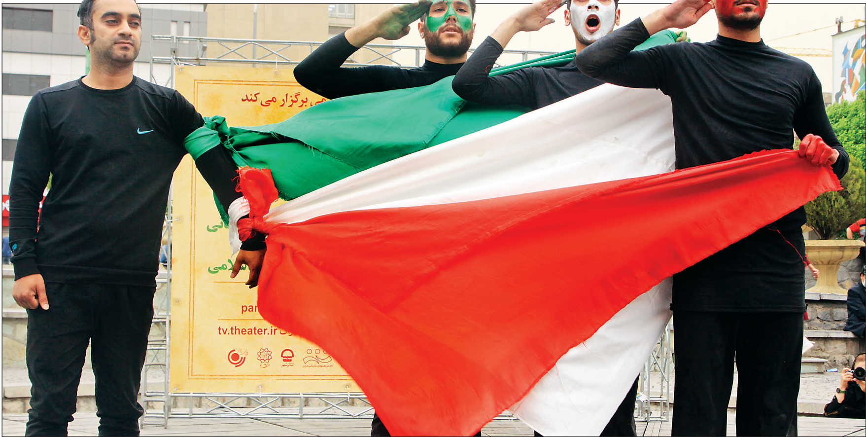
تئاتر خیابانی به مناسبت هفته هنر انقلاب