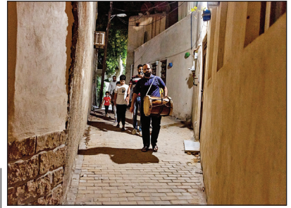
دُم دُم سحری

دُم دُم سحری ماه رمضان یکی از آیین‌های سنتی ویژه‌ماه مبارک رمضان در بوشهر است و بیشتر در محله‌های قدیمی این شهر (چهارمحال) برای بیدار شدن روزه‌داران مورد استفاده قرار می‌گرفته. تعدادی از مردم محله کوئی شهر بوشهر به رسم قدیم این آیین را زنده نگه می‌دارند. حضور و شوق کودکان در نیمه شب‌های ماه رمضان در تاریکی و خلوتی کوچکی طراوتی به این مراسم می‌بخشد. برخی از ساکنان این محله به وقت سحر منتظر این گروه هستند و از آنان با نوشیدنی و خوراکی استقبال می‌کنند. شعرهایی که خوانده می‌شود شامل محمد یا رسول الله، علیا ولی الله، السلام السلام یا شهر رمضان یا شهر صیام علیک السلام است.