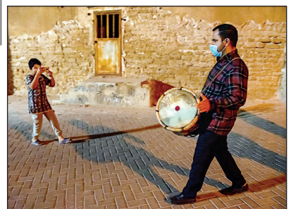
دُم دُم سحری