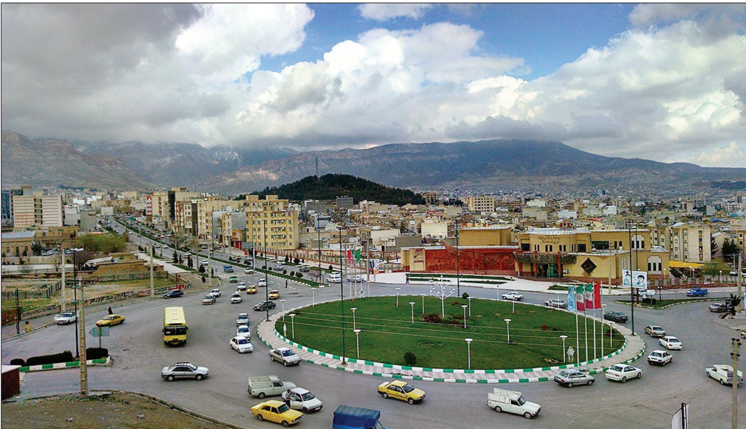
شرح عکس نمایشی از شهر ایلام

کشت قراردادی می‌تواند یکی از طرح‌های راهگشا برای تولید برنج در استان‌های شمالی باشد؛ به شرطی که جزئیات آن از ابتدای امر به درستی انجام شود و همین اجرای درست مشوق شالیکاران برای سال‌های آینده باشد.