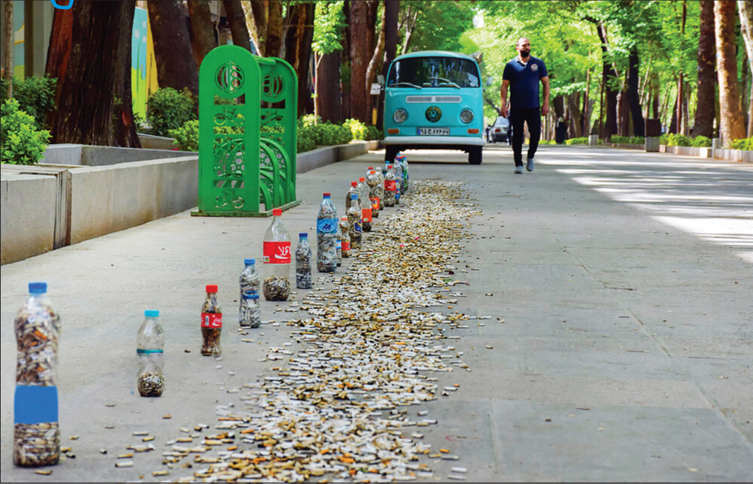
گذرگاه یک پارک در اصفهان و این همه ته‌سیگار