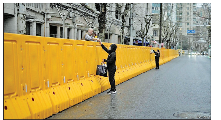
راهپیمایی حامیان عمران خان در اسلام آباد

سرعت شیوع امیکرون بسیار بالاست و این سرعت، مدیریت آن را دشوار ساخته است؛ حتی برای کشوری مانند چین که همواره تلاش داشته هر نوع شیوعی را بلافاصله در نقطه خفه کند. شناسایی خوشه‌های آ مبتلایان جدید در شانگهای (بزرگ‌ترین شهر چین و موتور محرک اقتصاد این کشور) اعتبار مدیران در این شهر را زیر سؤال برده است. در نتیجه دولت چین مجبور به اعمال قرنطینه‌های به شدت سختگیرانه برای مدتی نامشخص شده است؛ قرنطینه‌های که اقتصاد چین به هیچ‌وجه آمادگی آن را نداشته است. اکنون وضعیت در گزارشی درباره ضربه اقتصادی بزرگی که موج امیکرون به اقتصاد چین وارد کرده نوشته است که جدیدترین آمارهای رسمی منتشر شده از اقتصاد چین به ۲ ماه قبل برمی‌گردد؛ زمانی که به‌عنوان مثال، تعداد موارد ابتلای روزانه در شانگهای کمتر از ۵۰ مورد بوده است. اکنون آمار روزانه ابتلا به بیش از ۴۰۰ مورد رسیده است. در این شرایط، استفاده از آمار دولتی، برای برآورد تبعات اقتصادی امیکرون در چین نمی‌تواند چندان دقیق باشد.