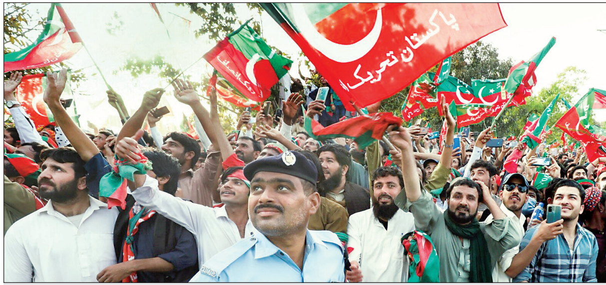
راهپیمایی حامیان عمران خان در اسلام آباد

تعلیق یکباره پارلمان پاکستان به درخواست نخست‌وزیر، سایه تردید را بر آینده سیاسی این کشور گسترده است