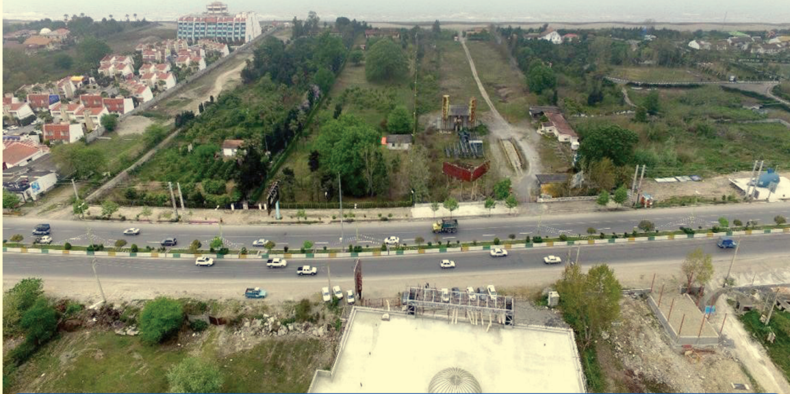
شرکت‌های بین‌المللی توسعه ساختمان و نارنجستان زیبای شمال