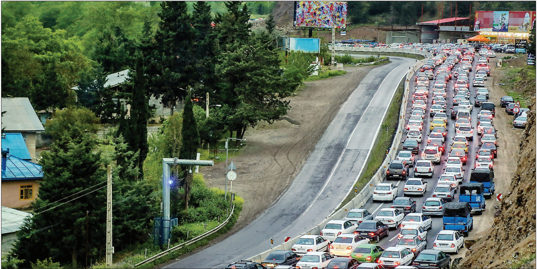
عکس همشهری اسرافیلوزیان