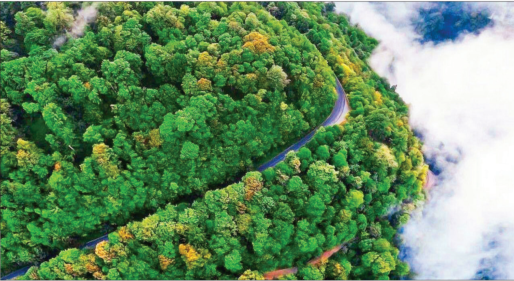
جاده اسالم به خنخال