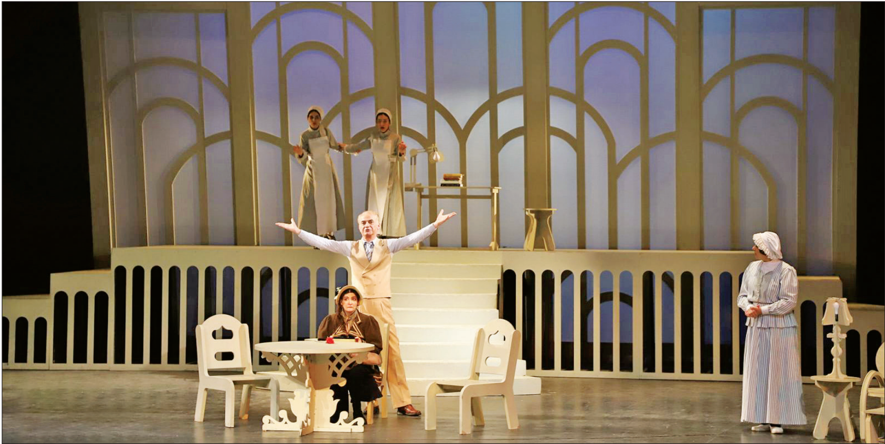
بعد از سال تعطیلی سالن های نمایشی بافوق‌العاده‌ترین کارگردانی گلایه از وضعیت تئاتر نمایش های برخط ۱۳۰۰ باشد