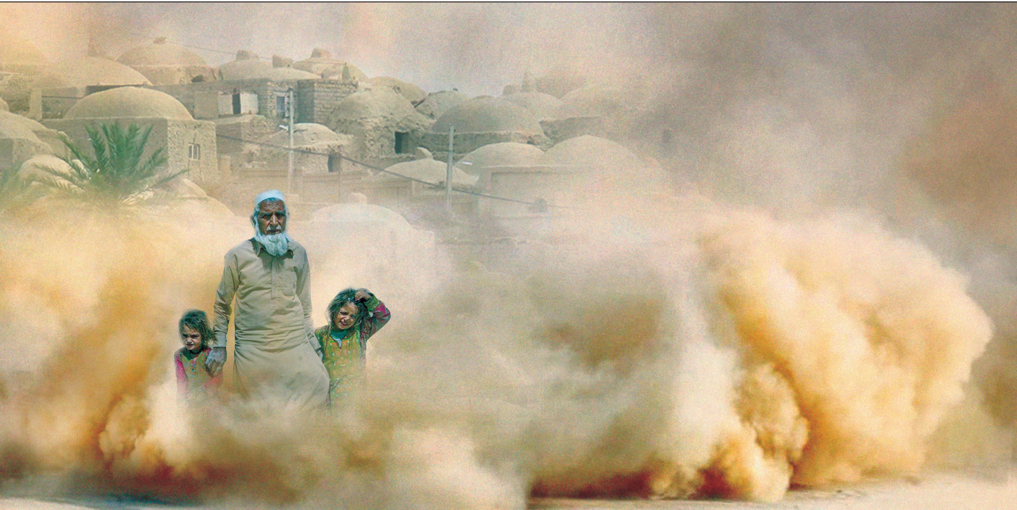
طرح: محمد علی خلیلی