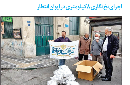
اجرای نختنگاری ۸ کیلومتری در ایوان انتظار

اسفند امسال، همزمان شدن جشن‌های نیمه‌شعبان با شور و شوق نوروزی، فرصتی برای اجرای برنامه‌های فرهنگی متنوع در شهرها فراهم کرده است. این مراسم با مسابقات ورزشی، نمایشگاه‌ها، و نوازش و شادمانی در فضای شهر فراهم کرده است. به گزارش همشهری، در روزهای آینده پویش «به عشق مهدی هواداریم» از سوی کلاسشهرهای ایران به میزبانی مسجد جگرمان برگزار می‌شود.