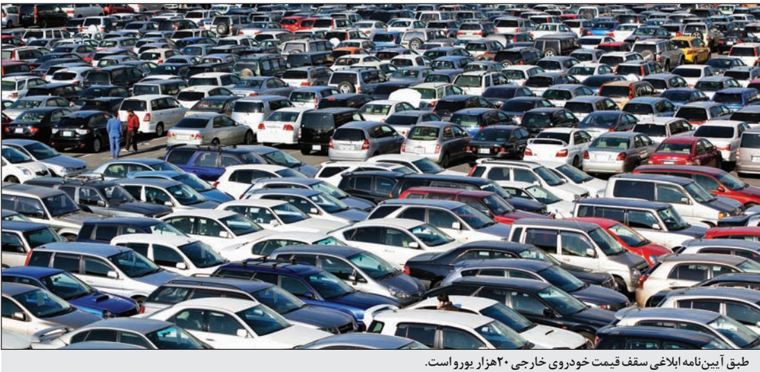
طبق آیین‌نامه ابلاغی سقف قیمت خودروی خارجی ۲۰هزار یورو است.

اقدام قابل‌توجهی است که می‌تواند به شفافیت عرضه خودروهای وارداتی منجر شود، زیرا پیش از این بحث‌های زیادی درباره نحوه تخصیص این خودروها به متقاضیان مطرح بود و برخی تحلیلگران معتقد بودند ممکن است در جریان فروش این خودروها رانتی از جهت سهمیه‌بندی به برخی متقاضیان اعطا شود.