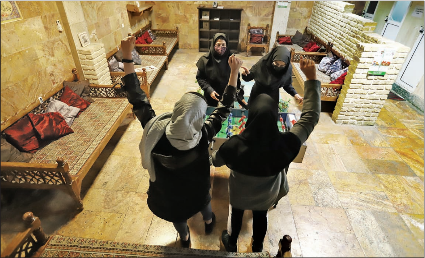
عکس همشهری از استارل

ایجاد نخستین شهر دخت نوآور پایتخت در دستور کار مدیریت شهری قرار گرفت