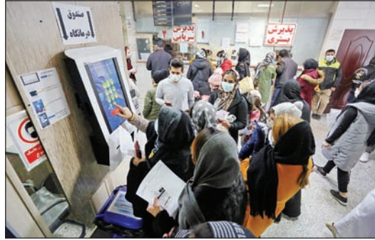
سالن پذیرش پُر از کودکانی است که بی‌حال با چشم‌های ترس‌خورده، در آغوش مادر کز کرده‌اند. اغلب رنگ پریده‌اند. تعدادی در انتظار رسیدن جواب آزمایش‌اند و تعدادی هم بیماری دیگری غیر از کرونا دارند. به گفته یکی از مسئولان بیمارستان، مراجعه‌های

انتظار ۱۲ ساعته برای نتیجه تست کرونا در راهروی ورودی منتهی به اورژانس صدای اعتراض از نبود تخت برای بستری شدن بچه‌ها شنیده می‌شود: «باید صبر کنید، تخت خالی نداریم». این پاسخ سرپرستار بخش به اعتراض‌هاست. تمام تخت‌ها پر است و مردم منتظر اعلام شدن نتیجه تست PCR که ۱۲ ساعت طول می‌کشد تا پاسخش بیاید. کودکان دارای علائم و بدون علامت را کنار هم روی تخت‌هایی با فاصله کم خوابانده‌اند و به گفته یکی از پرستاران این بخش بیشتر تست‌هایی که از کودکان دارای علامت گرفته می‌شود، مثبت است و برخی از آنها حتماً بستری می‌شوند. دختر ۹ ساله‌ای آماده ترخیص است. او از دیشب