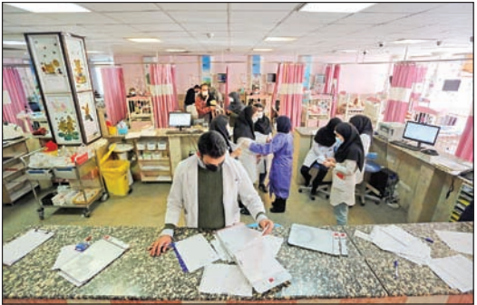
جداً از دیگران بگذارند. حالا هم به مسئولیت خودمان ترخیص می‌کنیم و امیدوارم که بچه مبتلا نشده باشد.»

اتاق اورژانس باید مبتلا شده باشد: «واقعاً در این بیمارستان، پزشکان با این مسئله فکر نمی‌کنند که بچه‌های بدون علامت را