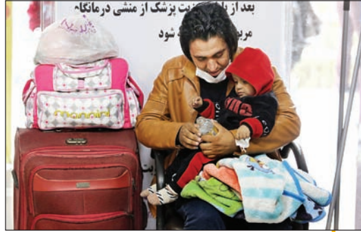
روزی ۵۰۰ مراجعه برای ورود به بخش پذیرش بیمارستان کودکان مفید، یابنداز میان جمعیت زیادی گذشت.