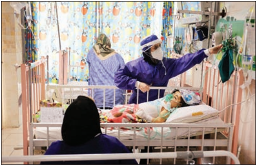
آمده و چند سرم گرفته و حالش بهتر شده است. مادر بزرگش می‌گوید کرونا ندارد اما احتمالاً از دیشب تا حالا با این وضعیت

انتظار ۱۲ ساعته برای نتیجه تست کرونا در راهروی ورودی منتهی به اورژانس صدای اعتراض از نبود تخت برای بستری شدن بچه‌ها شنیده می‌شود: «باید صبر کنید، تخت خالی نداریم». این پاسخ سرپرستار بخش به اعتراض‌هاست. تمام تخت‌ها پر است و مردم منتظر اعلام شدن نتیجه تست PCR که ۱۲ ساعت طول می‌کشد تا پاسخش بیاید. کودکان دارای علائم و بدون علامت را کنار هم روی تخت‌هایی با فاصله کم خوابانده‌اند و به گفته یکی از پرستاران این بخش بیشتر تست‌هایی که از کودکان دارای علامت گرفته می‌شود، مثبت است و برخی از آنها حتماً بستری می‌شوند. دختر ۹ ساله‌ای آماده ترخیص است. او از دیشب