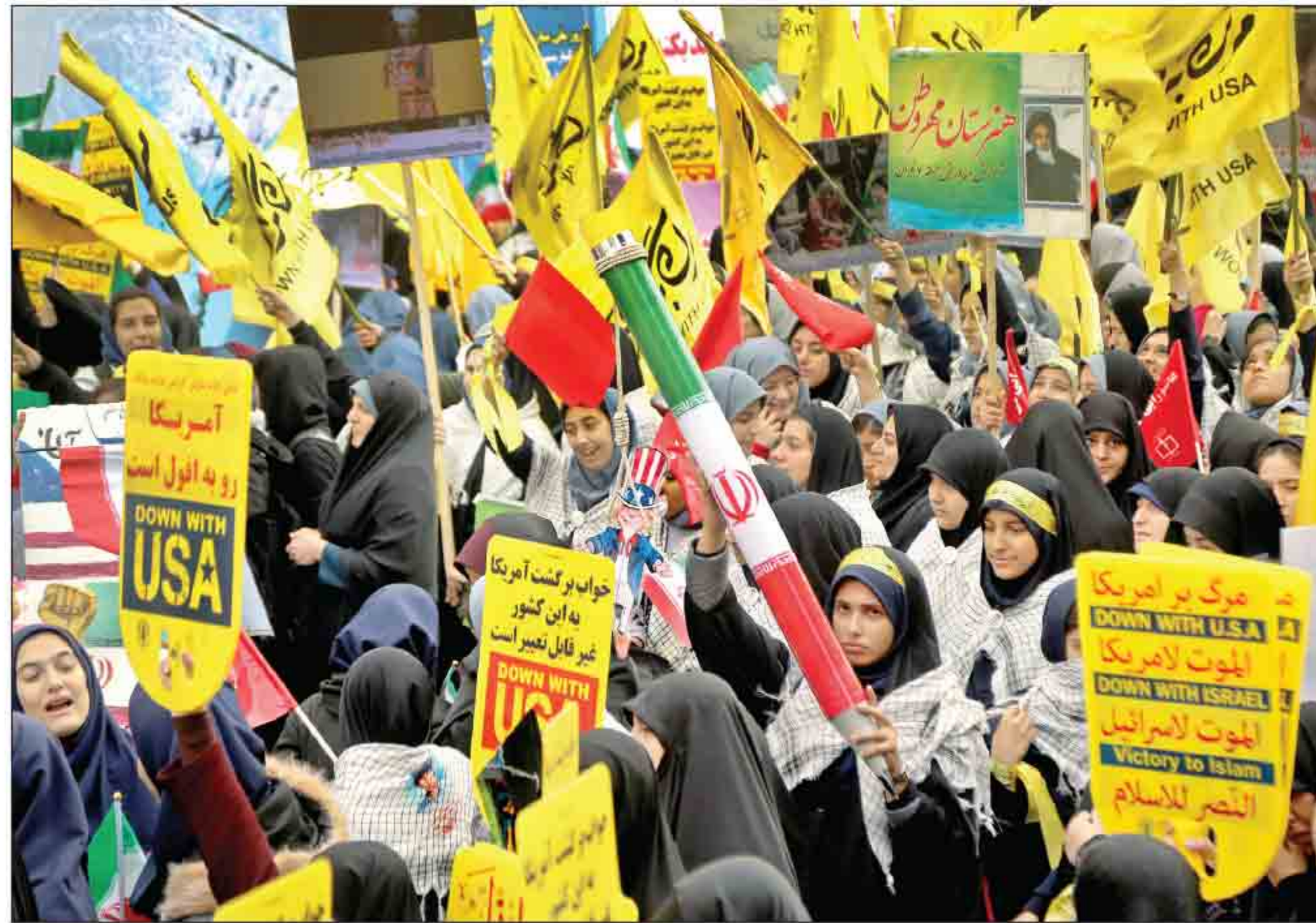
شکل‌های مختلف اعتراضی در تهران