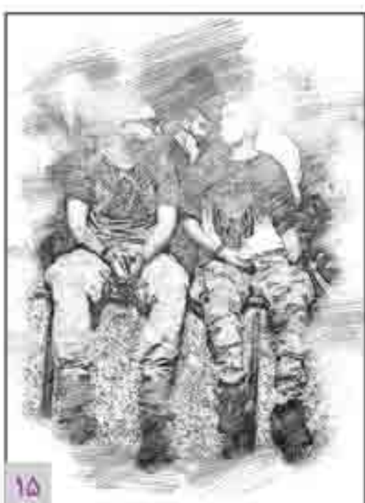
نسل پیاده روها

چهارشنبه ۱ آبان ۱۳۹۸ | ۲۴ صفر ۱۴۴۱ | سال بیست و هفتم | شماره ۷۷۹۱ | ۲۴ صفحه | ۴۰ صفحه راهنما ویژه تهران | ۲۰۰۰ تومان