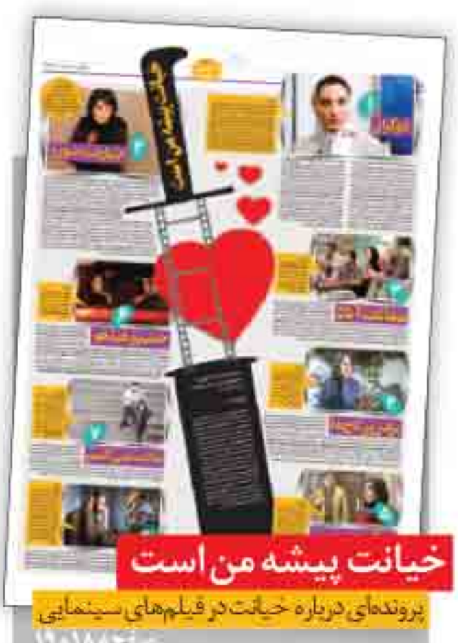
خباثت پیشه من است