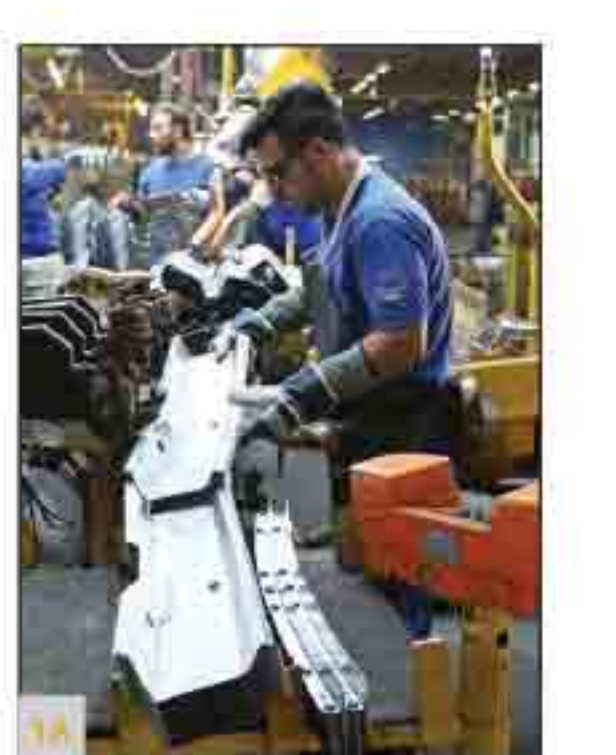
سر نوشت رشد اقتصاد تا ۱۴۰۰

سر نوشت رشد اقتصاد تا ۱۴۰۰ آیا اقتصاد ایران در ۲ سال آینده از رکود خارج می‌شود؟ گفت‌وگو با ۱۰ کارشناس اقتصادی درباره مسیر رشد اقتصاد ایران در ۲ سال آینده