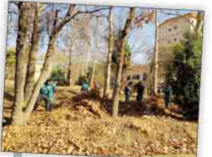
آزادسازی یادگان ۶۰ یعنی نیم‌متر فضای تنفسی بیشتر برای هر شهروند