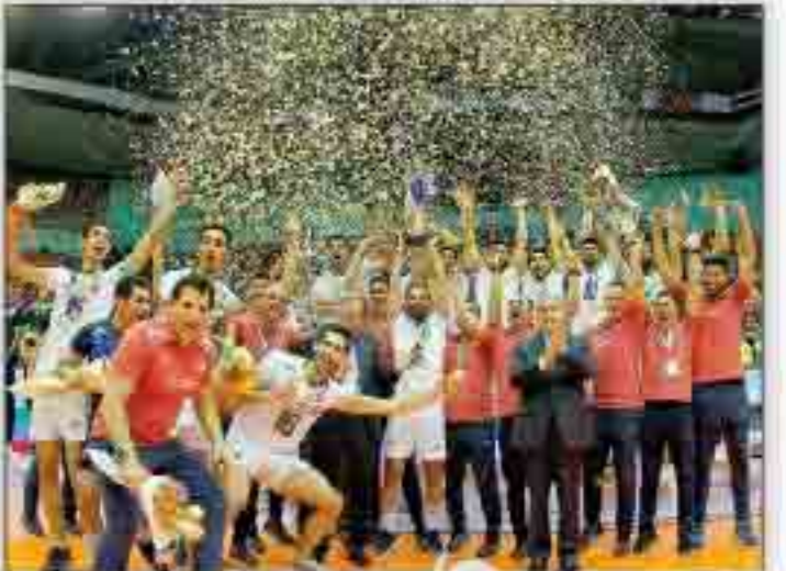
انتقام مثل آب خوردن والیبال ایران با پیروزی مقتدرانه مقابل استرالیا برای سومین بار قهرمان آسیا شد