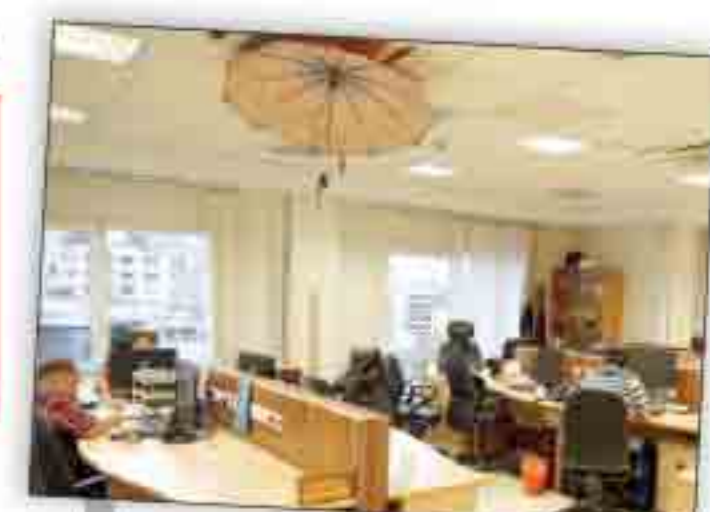
خبرنگاری، خارج از متن همزمان با روز خبرنگار، عده‌ای از خبرنگاران از حال و هوای خود و حرفه خبرنگاری می گویند