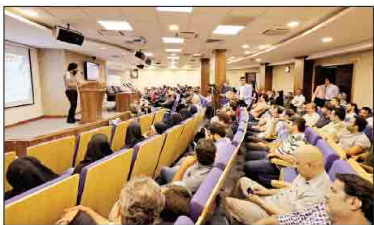
برگزاری صمیمانه روز خبرنگار در روزنامه همشهری

بهبستی برای آرامش پایتخت‌نشینان | برای آشنایی بیشتر با باغ‌های ایرانی تهران و معماری منحصر به فردشان، صفحه ۶ را بخوانید