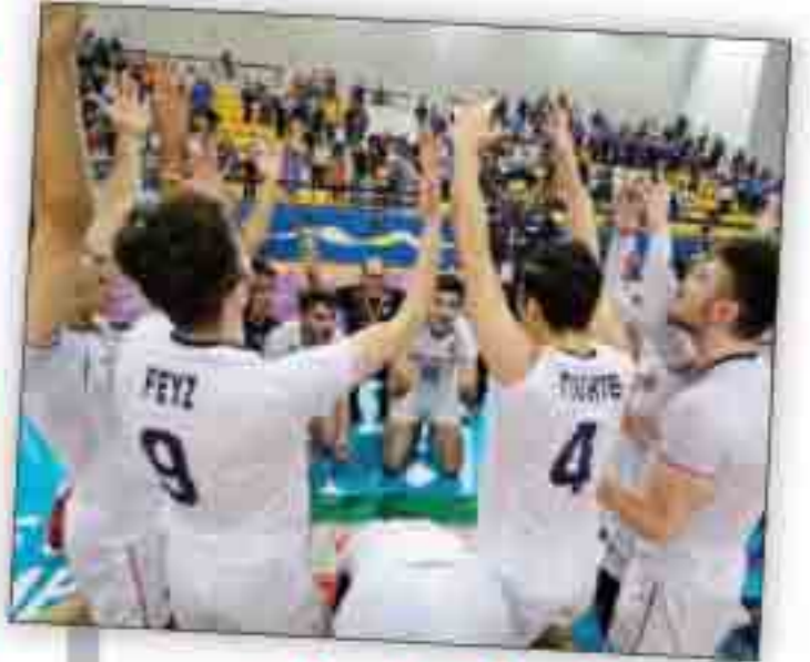
اولین قهرمانی یک تیم بالای ۲۰ سال ایران در جهان