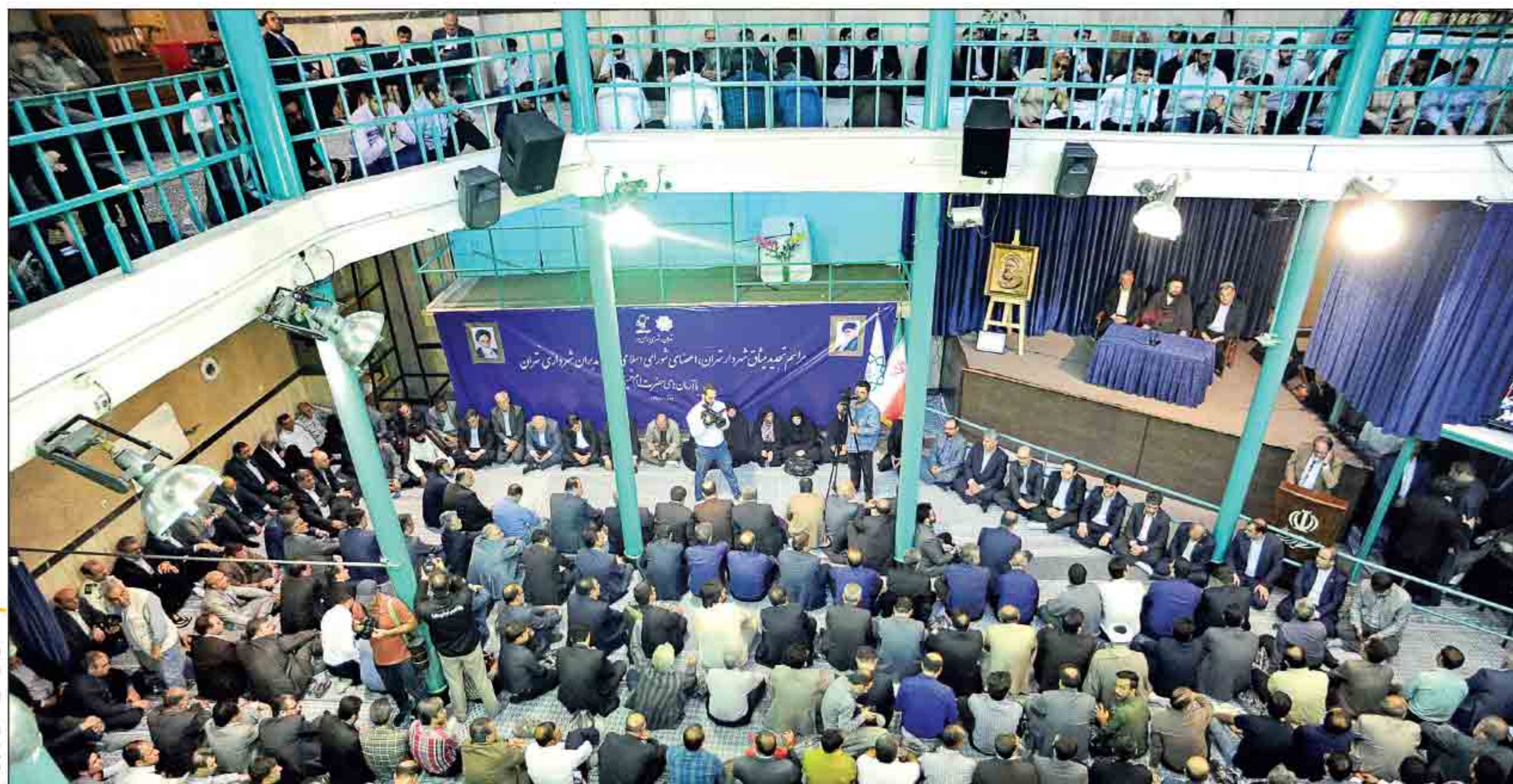
عقد جلسه معشای تهران

همشهری وضعیت بازار مسکن در ۴ منطقه ارزان قیمت پایتخت را بررسی کرده است