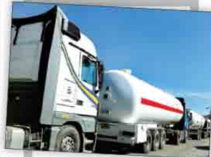
گوگرد کازوئیل همچنان بالاتر از حد مجاز

HAMSHAHRI | ISSN 1735-6386 | Vol.27 | No.7678 | MON JUN.03 | 2019 | صفحه ۶ | شماره ۷۶۷۸ | صفحه ۲ | صفحه راهنمای کشوری ویژه استان ها | صفحه راهنمای ویژه تهران | ۲۰۰۰ تومان