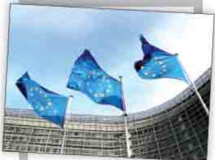
چراغ سبز برای ایجاد کانال‌های جدید بانکی