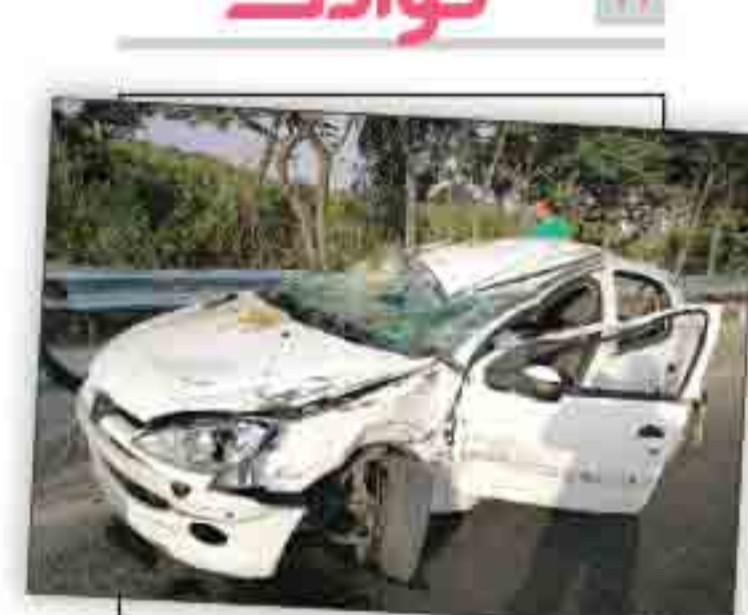
راننده مست جان ۵ کارگر را گرفت

سر نشینان پژو ۲۰۶ یک دختر ۳۳ ساله بودند که شب را به تماشای خسوف گذرانده بودند گفت‌وگو با راننده خودروی مرگ