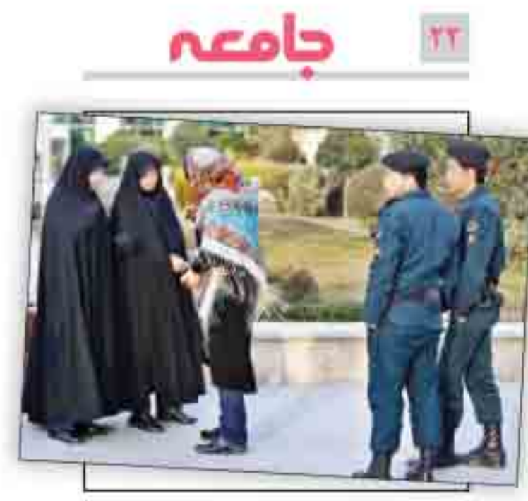
بی حجابی از تأثیر سلبریتی‌ها تا برخورد های خیابانی