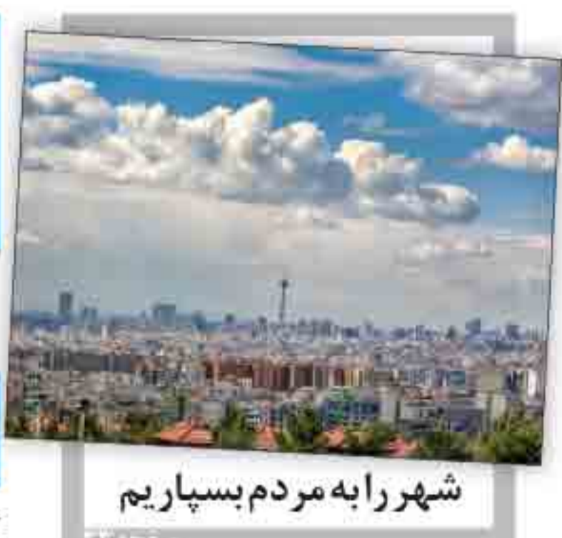
شهر را به مردم ببساریم