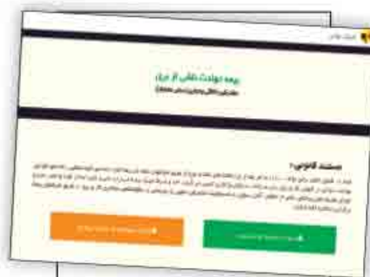
راهنمای دریافت خسارت قطع برق مشترکان خانگی