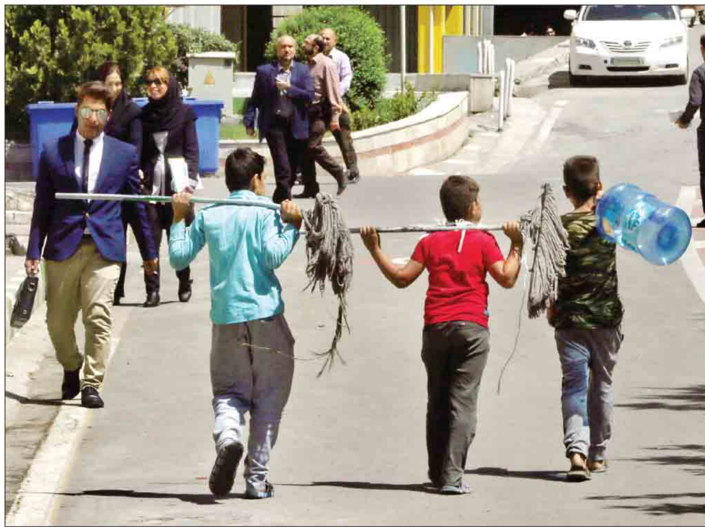
آزادی عکس همشهری، اسفند، خاسته‌ای

نام ایران در فهرست استفاده‌کنندگان از اعتبار ۸۰ میلیارد دلاری صندوق شرکت‌های کوچک و متوسط اتحادیه اروپا قرار گرفت