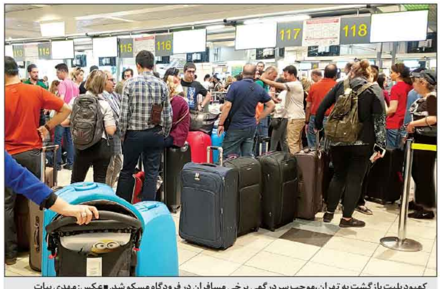
کمبود بلیت بازگشت به تهران، موجب سردرگمی برخی مسافران در فرودگاه مسکو شد.

سختگویی سازمان هواپیمایی کشوری: انجام پروازهای فوق العاده شرکت های هواپیمایی داخلی در مسیر مسکو-تهران را پیگیری می کنیم