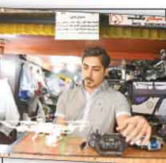
سرزمین اسباب بازی های خسته گزارش همشهری از مغازه های در قلب پایتخت که ۶۰ سال است تعمیرگاه اسباب بازی است