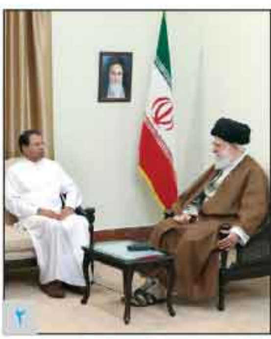
در دیدار رئیس جمهور سرایانکا صورت گرفت

تاکید رهبر معظم انقلاب بر گسترش همکاری کشورهای آسیایی