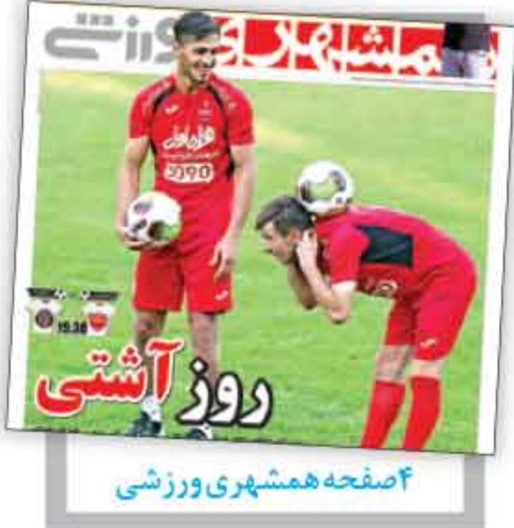
۴ صفحه همشهری ورزشی