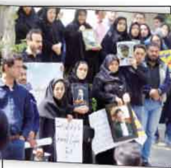
چشم انتظار پیکر عزیزان خانواده جانبازان هواپیمای آسمان جلوی ستاد مدیریت بحران تجمع کردند