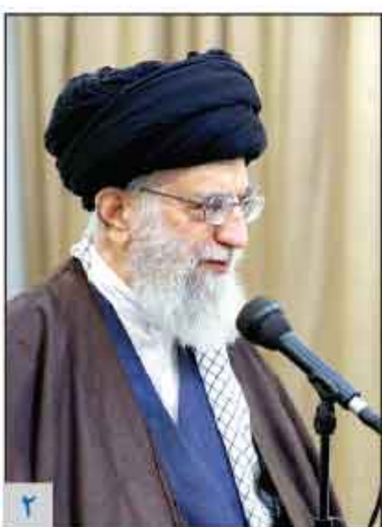
از سوی رهبر معظم انقلاب صورت گرفت