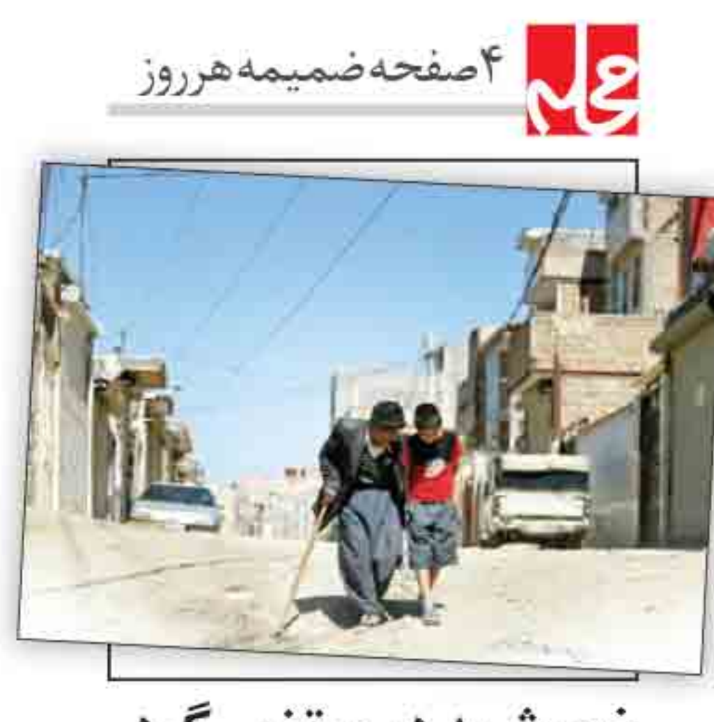
خورشید در مرتضی‌گرد طلوع می‌کند