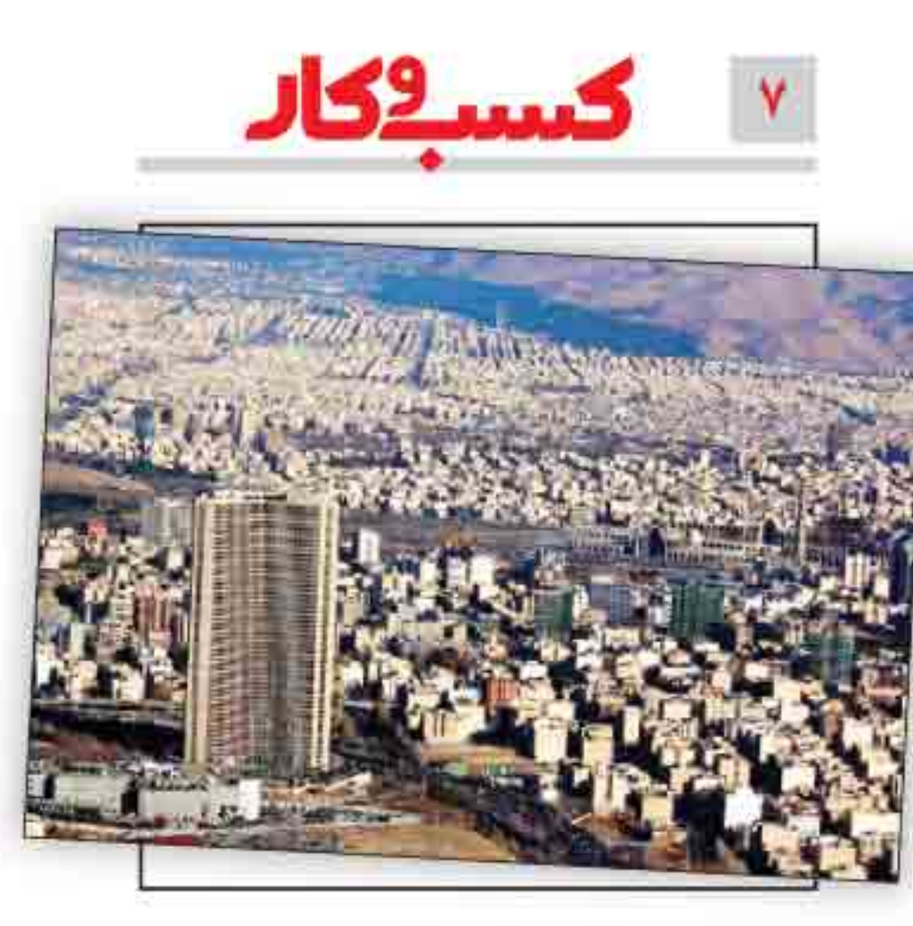
وام مسکن ارزان شد قیمت هر برگ اوراق تسهیلات مسکن به زیر ۷۰ هزار تومان کاهش یافت