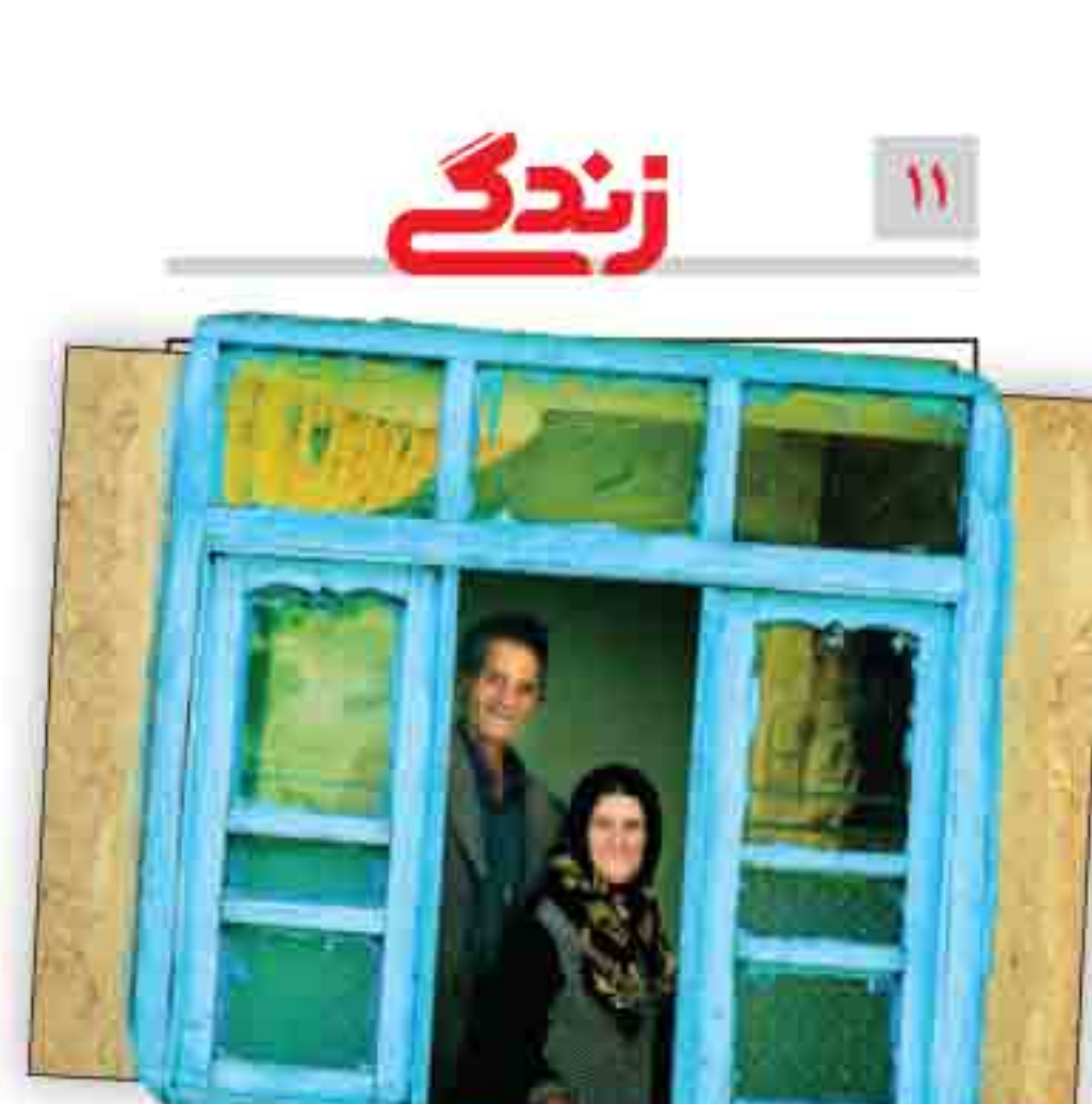
چگونه در سالمندی سالم بمانیم؟