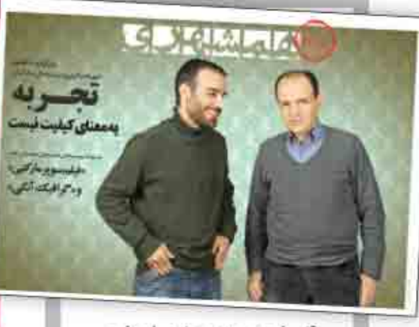
۴ صفحه ویژه جشنواره فجر